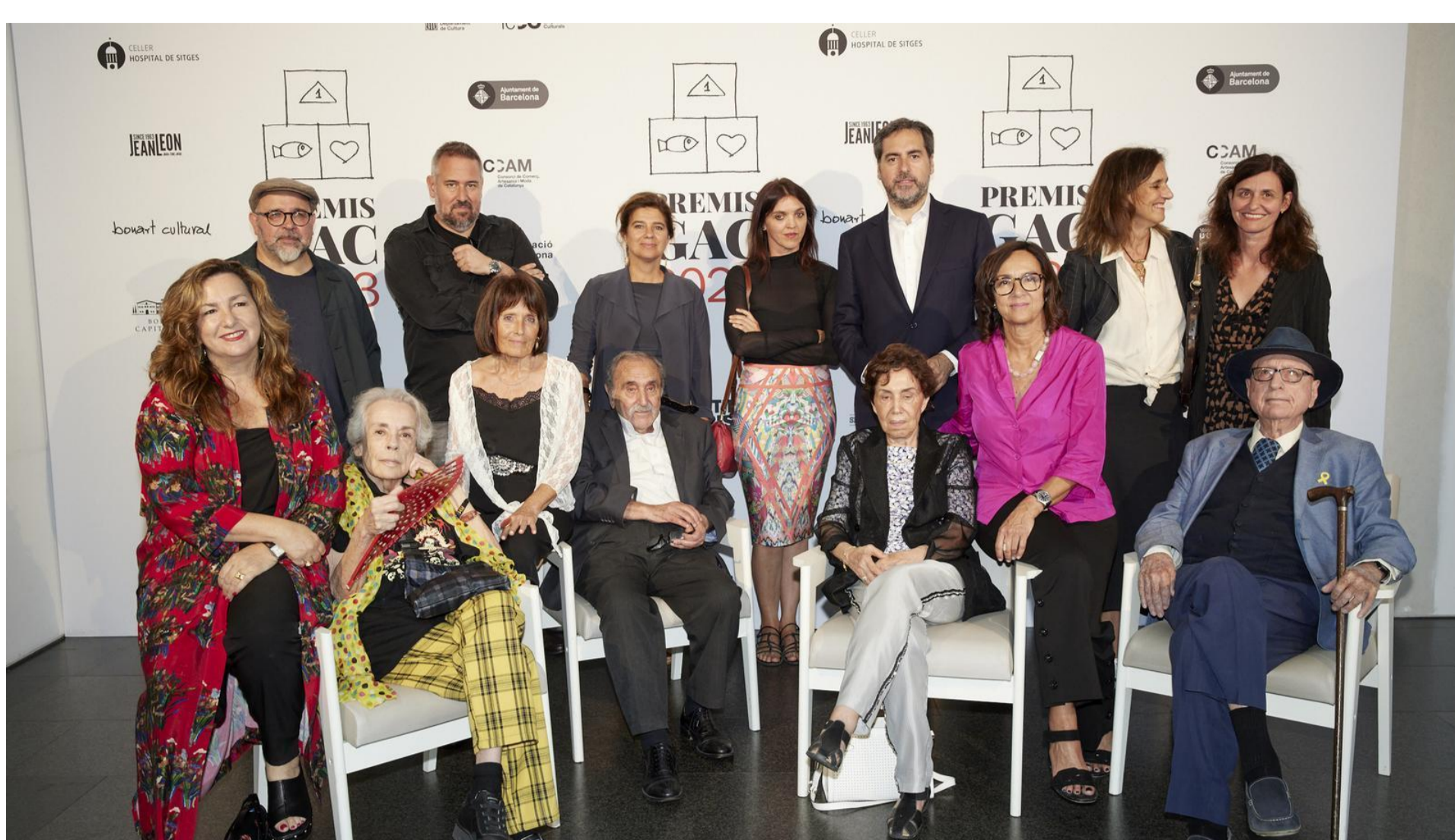
Foto de família dels guardonats en els Premis GAC 2023