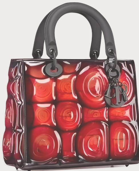
DIOR LADY ART intervingut per Kohei Nawa. 6.000 euros. Exclusivament en boutique