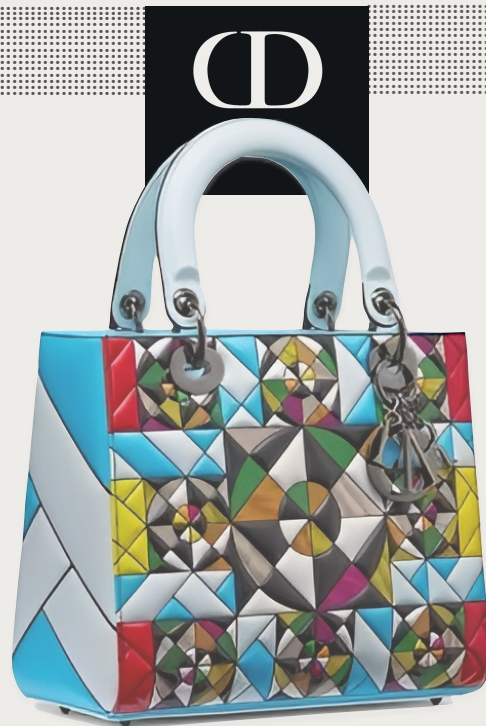
DIOR LADY ART intervingut per Eduardo Terrazas. 4.000 euros. Disponible pròximament

Per la seva banda, el japonès Kohei Nawa torna (9 anys després) a col·laborar amb la casa amb un dels seus típics xocs poètics. Inspirat en la seva instal·lació mòbil batejada com a Biomatrix , que evoca el bombolleig del magma, presenta quatre bosses de mà elaborades amb cèl·lules acolorides de PVC soldades a alta freqüència i farcides de gel que es metamorfosen segons la temperatura i la llum. Són peces molt visuals, igual que la intervenció de l'africà Athi-Patra Ruga, que ha concebut un Lady Dior que revela la seva pròpia cara, en un joc espectacular de relleus de brodats i perles. A més a més, n'ha fet una versió mini de color blau, un to molt apreciat per monsieur Dior, amb què pica l'ullet al vestit Junon, icona de l'alta costura de la firma creada el 1949. ●