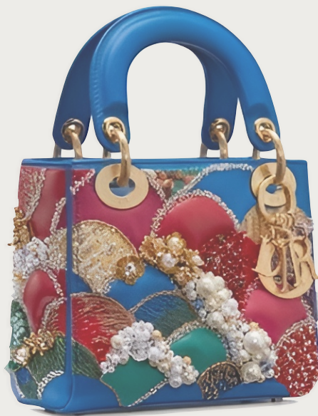
MINI DIOR LADY ART intervingut per Athi-Patra Ruga. 10.000 euros. Disponible pròximament