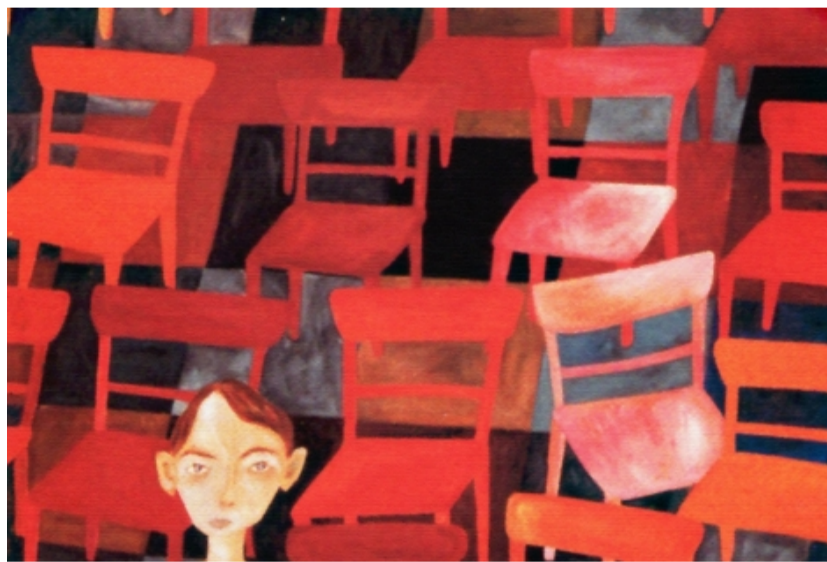
La pintura y el misterio de Arian Morera