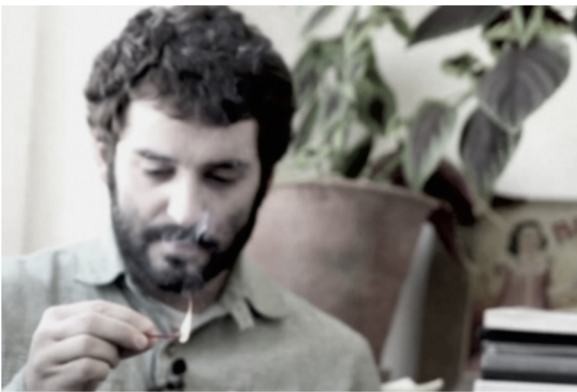
Sant Joan desde Montserrat y el puente de Joan Ponç ...