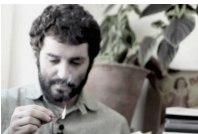
Sant Joan des de Montserrat i el pont de Joan Ponç