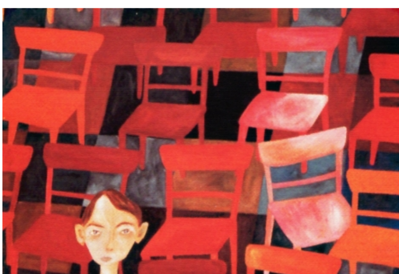
La pintura i el misteri d'Arian Morera