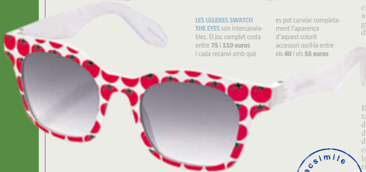
LES ULLERES SWATCH THE EYES són intercanviables. El joc complet costa entre 75 i 110 euros i cada recanvi amb què

es pot canviar completament l'aparença d'aquest colorit accessori oscil·la entre els 40 i els 55 euros