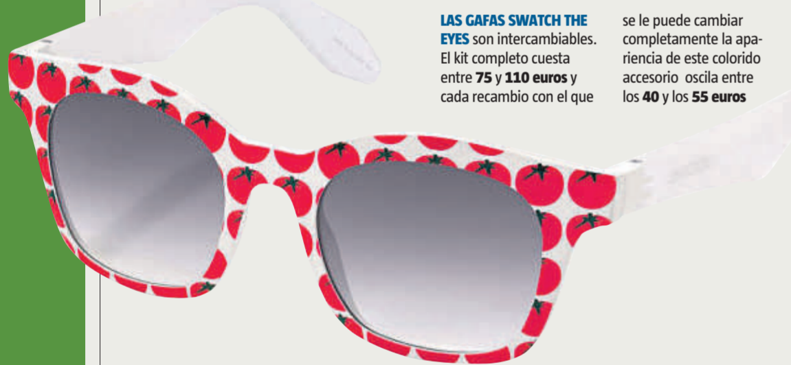
LAS GAFAS SWATCH THE EYES son intercambiables. El kit completo cuesta entre 75 y 110 euros y cada recambio con el que

se le puede cambiar completamente la apariencia de este colorido accesorio oscila entre los 40 y los 55 euros