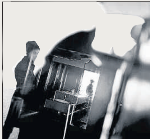
Cafè BCN, 2005, fotografia de Hiro Matsouka

En aquestes composicions es produeix una certa dissolució de la realitat visible, que significa també una expressió de sensacions subjectives. De vegades, podrien semblar composicions agitada, però no ho són, com tampoc no són vaguetats les idees que representen. Al contrari, Hiro Matsouka desenvolupa conscientment diferents reflexi-