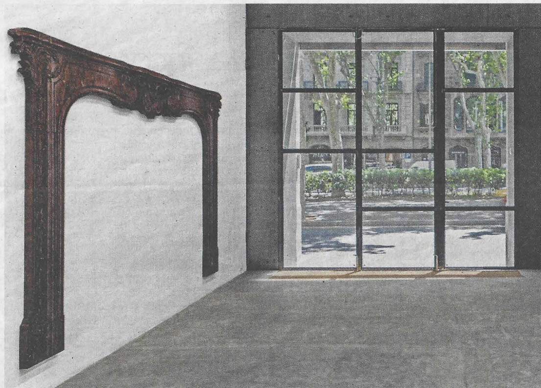
Una mostra de l'exposició de Lluís Hortalà a la galeria Rocío Santa Cruz.

TODA FOTOGRAFÍA ES UN ENIGMA Foto-Colectania. Fins al 21 de maig