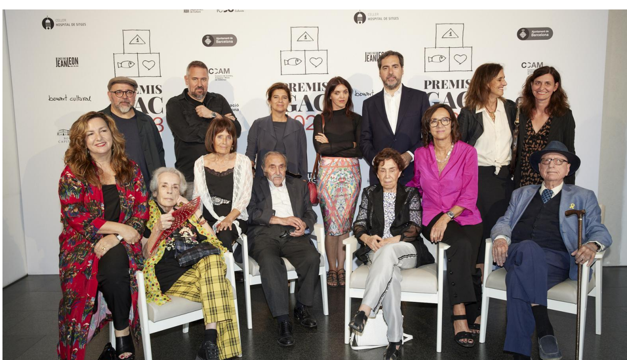
Foto de família dels guardonats en els Premis GAC 2023