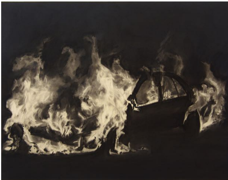
Revelacions 11 , 2017, pols de grafit sobre paper, 58 x 72,5 cm (22 9 / 16 x 28 9 / 16 in)