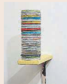
'Pila de tapes', 2016.