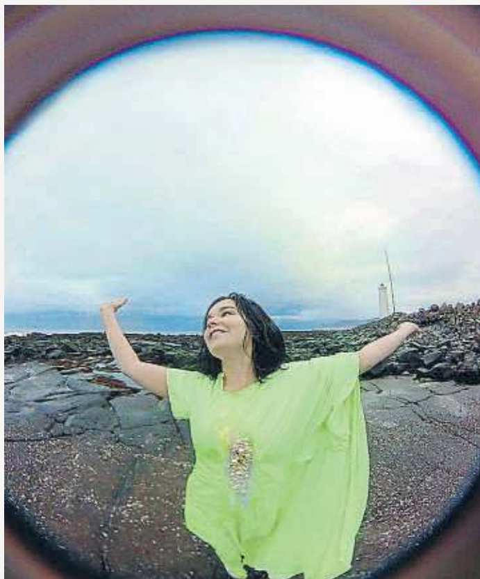
A sobre, 'Stonemilker VR'. A sota, 'Notget'.

Amb les ulleres de realitat virtual posades, i en un grup d'un màxim de 25 persones, recorreu vuit espais amb peces diferents, cadascuna correspon-