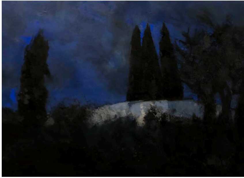
Reposo en Sant Joan, 2022, óleo sobre tela, 73 x 100 cm (28.7 x 39.4 in)

Inauguración: 17 de marzo de 2022, de 17h a 20h