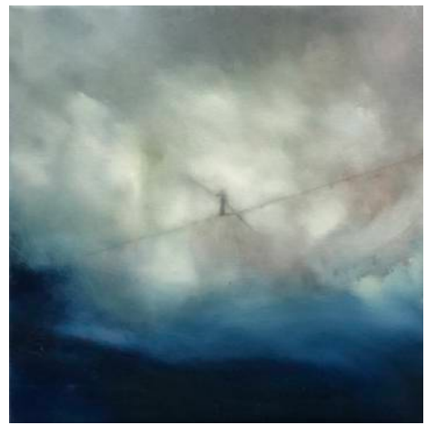
El largo camino, 2021, óleo sobre tela, 30 x 30 cm

A lo largo de la historia del arte, los momentos artísticos han basculado del sentimiento a la razón: del renacimiento al barroco, del barroco al clasicismo, del clasicismo al romanticismo, y así sucesivamente; incluso las tendencias que se sucedieron en a lo largo del siglo XX se decantaban por una u otra forma de enfrentarse al mundo. La obra de Daniel Berdala , en un momento dominado por el conceptualismo, prioriza el sentimiento y la individualidad. Quizás no es nada revolucionario (o sí) pero a nosotros nos resulta muy reconfortante. Siguiendo el modo de los románticos, Berdala se aparta de la voluntad de reproducir el estado de las cosas, para seguir los caminos invisibles que le llevan a la naturaleza y viceversa. Esto no quiere decir que se desentienda del entorno, todo lo contrario. Como decía Adorno, las obras de arte deben ser la historiografía de su tiempo, el subconsciente de la historia. Precisamente es el entorno y la circunstancia (en el sentido filosófico del término) lo que provoca en nuestro artista, la necesidad de "reconciliar lo irreconciliable" y sólo lo logra pintando desde las coordenadas de su atlas interior.