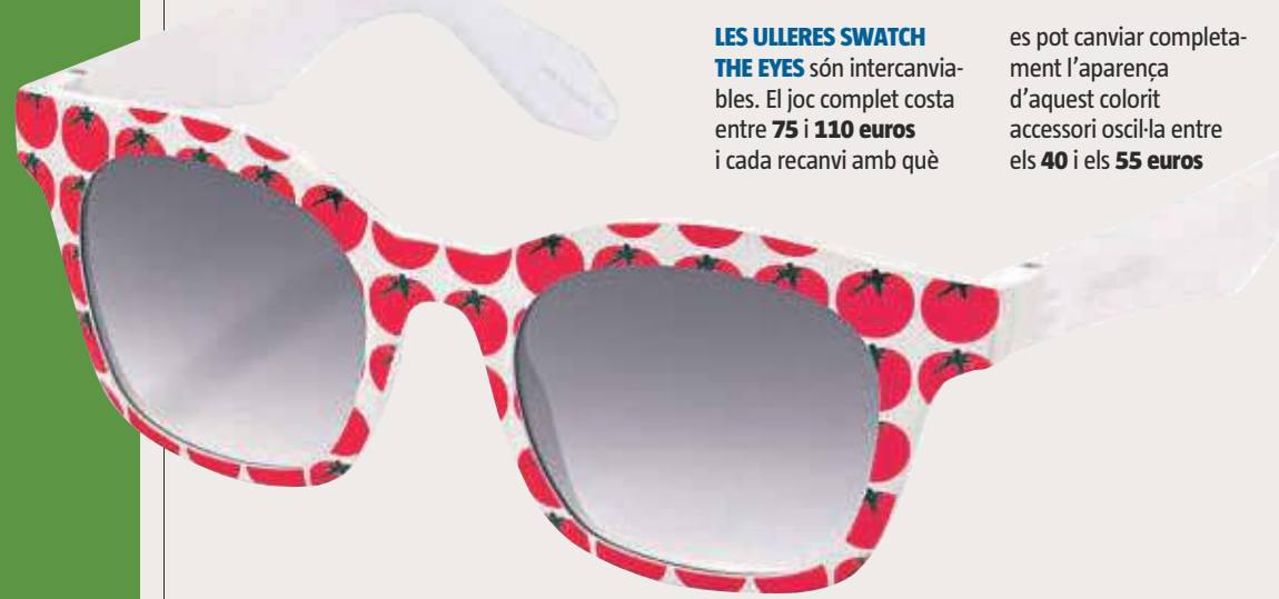
LES ULLERES SWATCH THE EYES són intercanviables. El joc complet costa entre 75 i 110 euros i cada recanvi amb què

es pot canviar completament l'aparença d'aquest colorit accessori oscil·la entre els 40 i els 55 euros