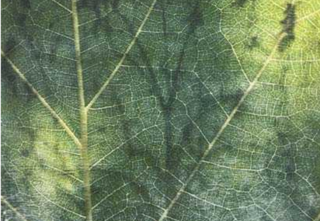
Elena Kervinen. Vida de la libèl·lula II. 2019.

L'artista andorrana Fiona Morrison presenta dos transferibles sobre paper amb els títols Fulla 1 i Fulla 2 . (2019). Si ens aproximem a les obres veurem les nervacions de les fulles, com si fossin les pintures rupestres de figures esquemàtiques que est troben a les coves o abrics. A més, també sorgeix l'ombra d'una mà per evidenciar la presència de l'ésser humà al món de la natura que, com senyala Abel Figueras referint-se a l'anterior exposició de Morrison a la galeria, "es poden veure també (...) imatges d'anrbes, fulles, boscos, cims, celatges, ocells i plomes; unes imatges que, en conjunt, conformen un determinat ambient intangible, delicat, amb reminiscències i records de la natura".