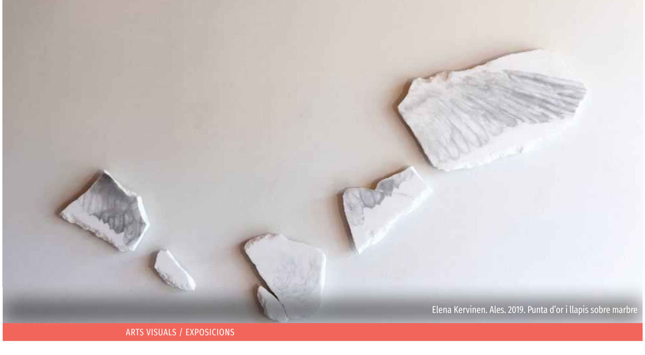
Elena Kervinen. Ales. 2019. Punta d'or i llapis sobre marbre