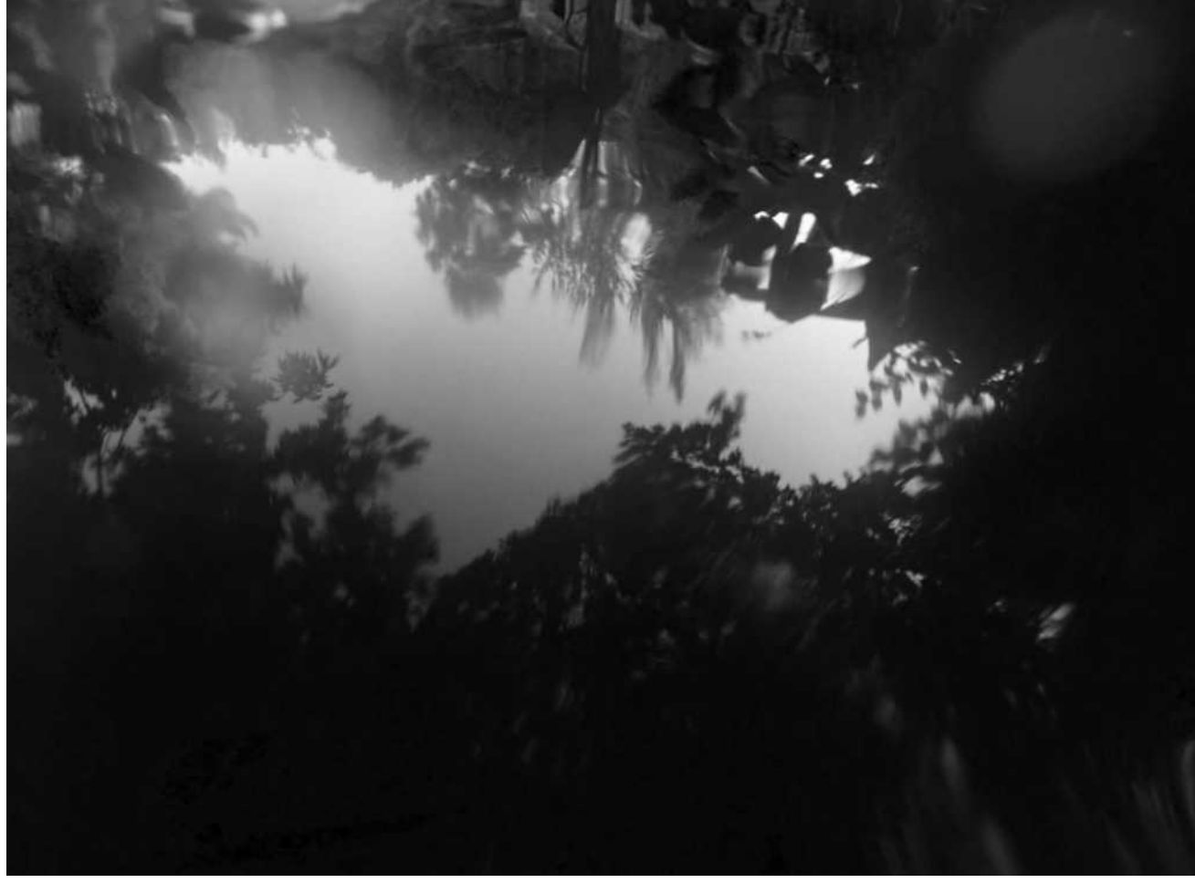
Amparo Fernández. Agua-aire 4. 2019. Impresión digital. Edición de 5 ejemplares.

En la obra la Odisea de Homero es donde por primera vez se menciona los lotófagos durante el viaje de Ulises hacia Ítaca. Una fuerte tormenta desvió la nave hacia una isla cercana a África del norte donde sus habitantes los recibieron muy amablemente y los ofrecieron de comer el fruto del loto como señal de bienvenida. El efecto por su consumo les hizo olvidar de volver al barco hasta que Ulises consiguió rescatar a los hombres y devolverlos. A través de esta historia, Homero apela al simbolismo de la flor de loto para describir un deseo humano: la posibilidad de borrar el pasado para empezar de nuevo.