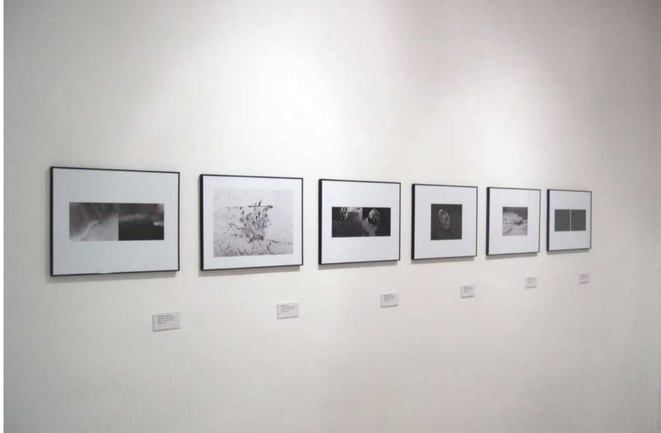
Vista de la exposición Flor de loto de Amparo Fernández.

En un momento como el actual en el que el silencio, la pausa y la introspección deben ser percibidos como espacios de meditación, interrogación y profundización, Amparo Fernández nos ofrece una oportunidad para adentrarse en un ejercicio fotográfico en el que el paso del tiempo se convierte en una práctica y un aprendizaje personal, único e irrepetible. Una fuerte carga simbólica, con la que se establece un paralelismo espiritual con la vida humana.