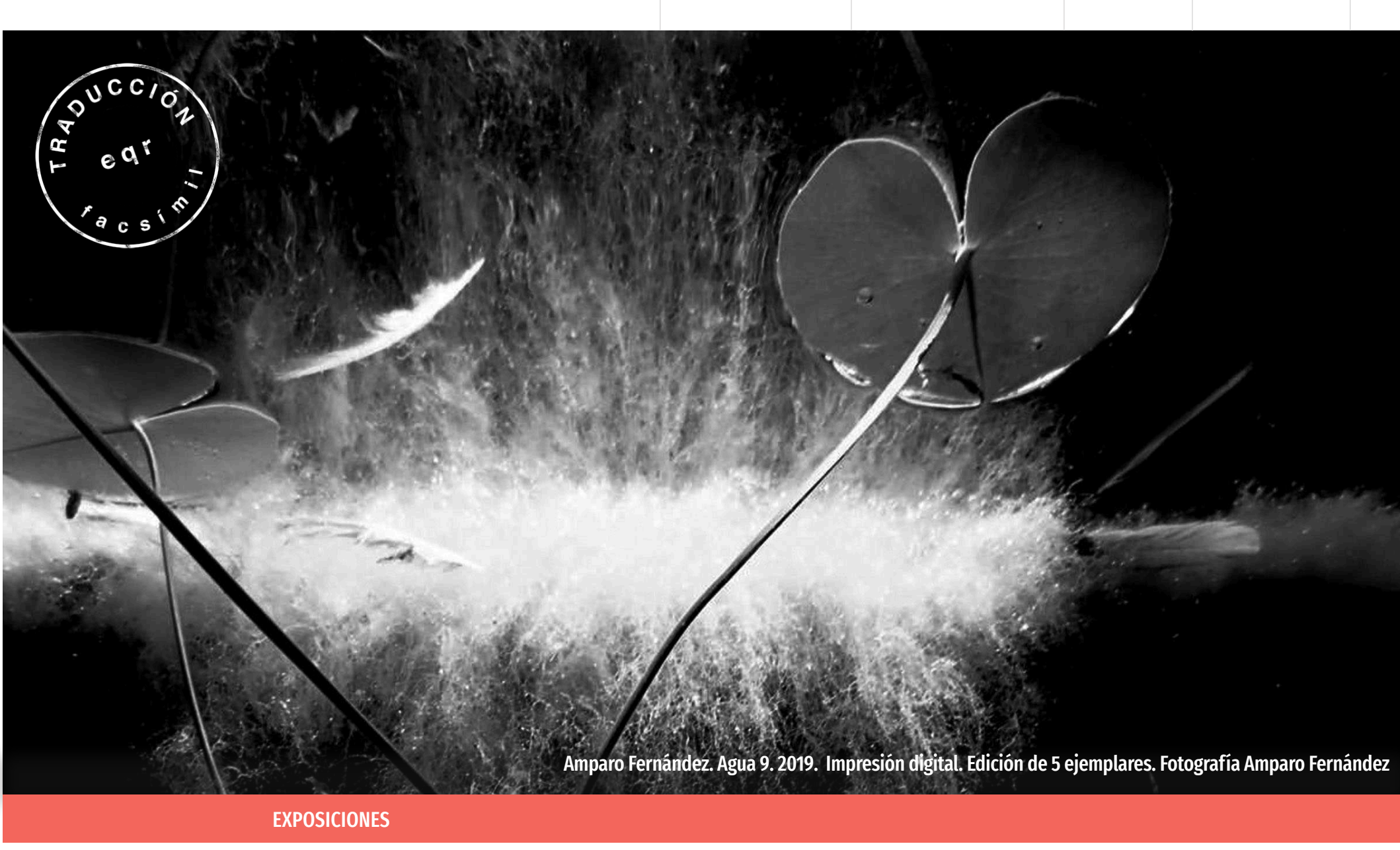
Amparo Fernández. Agua 9. 2019. Impresión digital. Edición de 5 ejemplares. Fotografía Amparo Fernández