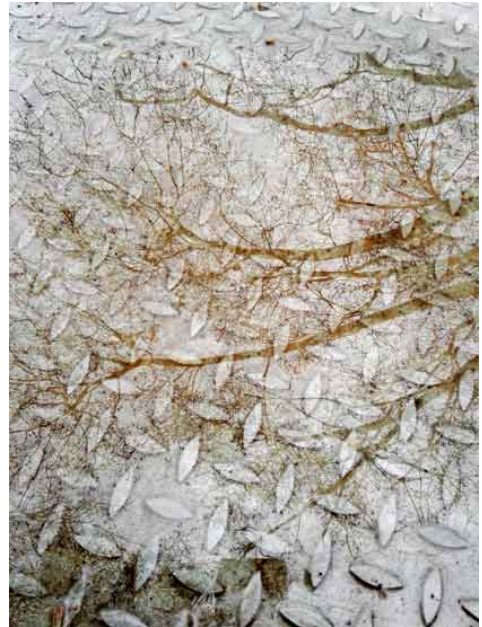
Steel trees, 2019, impressió. digital sobre alumini, 40 x 30 cm, ed. 5 ex.