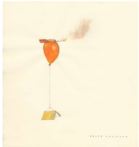
Llibre d'acció Carles Hac Mor, 2018 aquarel·la, 21 x 23 cm

L'exposició estarà oberta fins al 30 d'octubre del 2021. Per a més informació, contactar amb la galeria: info@elquadernrobot.com – 93 368 36 72 el quadern robot, còrsega, 267, principal 2 b, 08008 barcelona, elquadernrobot.com