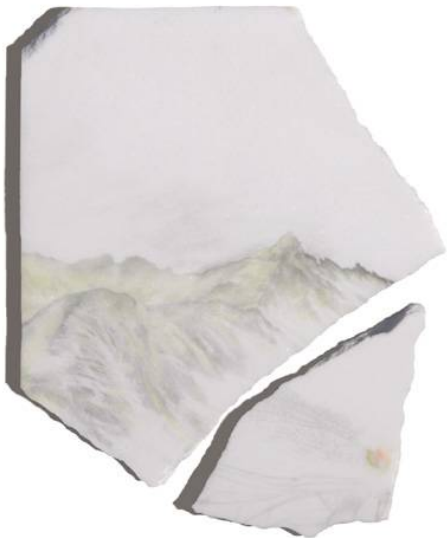
Vida de la libel·lula II, 2019 tècnica mixta sobre marbre, 32 x 25 x 2 cm