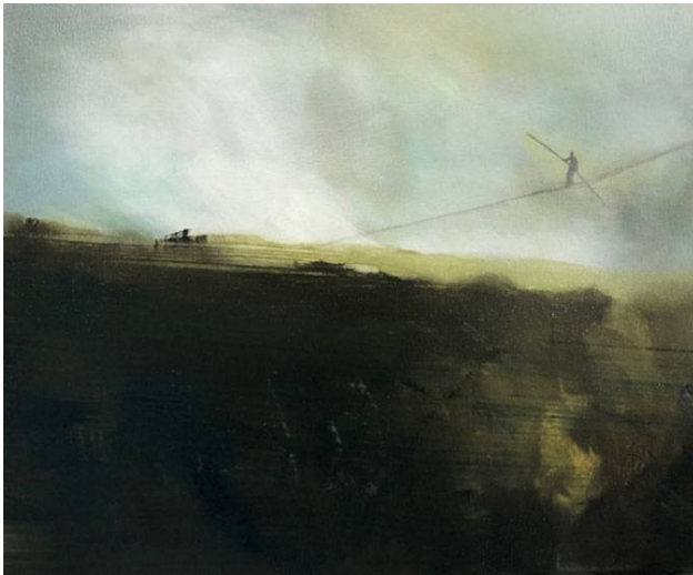
Retornant a l'horitzó, 2021 oli sobre tela. 30 x 45 cm