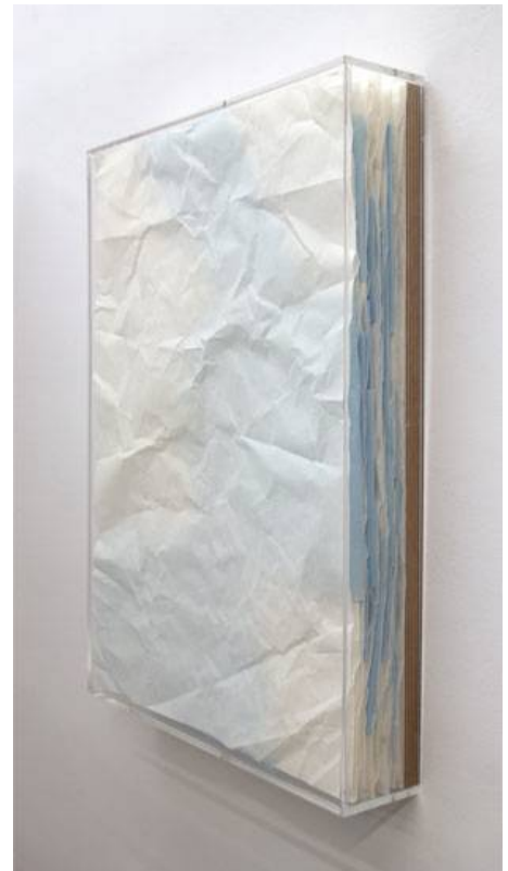
Cigrons, llenties i regals, 2021 tècnica mixta paper, 51,2 x 35,6 x 7,1 cm