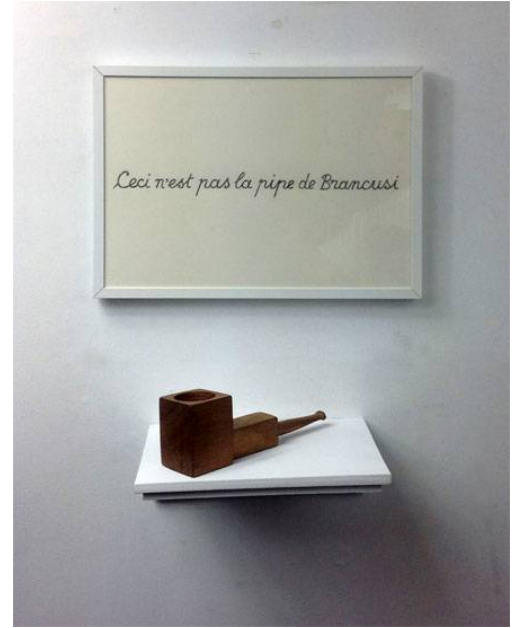
Ceci n'est pas la pipe de Brancusi, 2021 fusta d'Iroco i dibuix a llapis sobre paper 22 x 36 x 18 cm