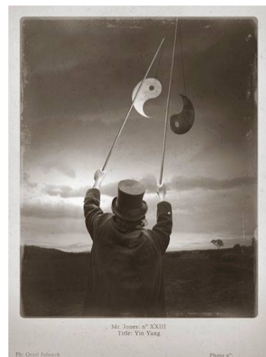
Mr. Jones XXIII. Yin Yang, 2017 impressió digital, 18 x 13 cm, ed. 25 ex.