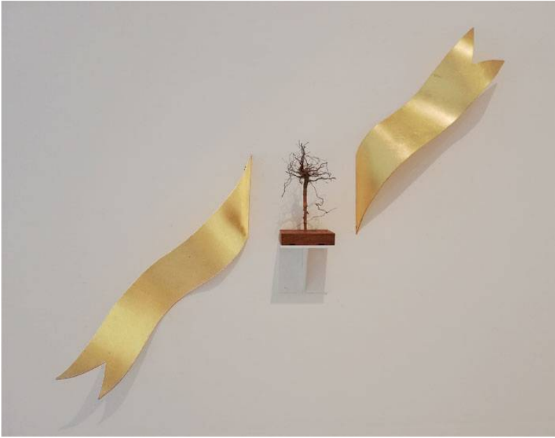
L'accident de ..., 2021, alumini daurat i arrel de gerani, 85 x 74 x 12 cm, edició de 10 ex.