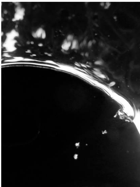
Aigua 12, 2019 impressió digital, 30 x 40 cm, ed. 10 ex.