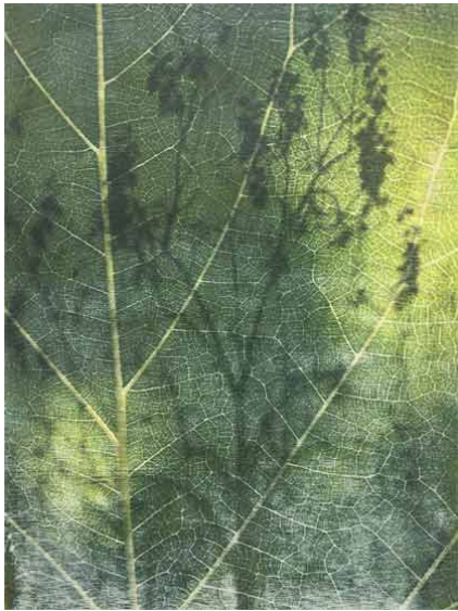
Fulla 2, 2019, exemplar únic. transfer sobre paper, 29 x 22,5 cm