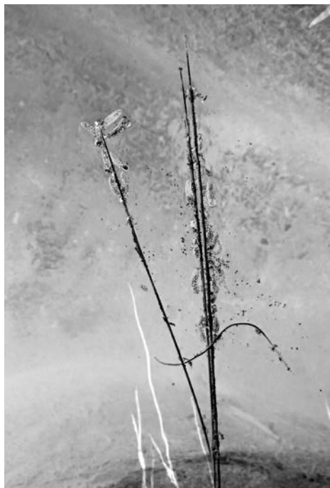
Aigua 7 , 2019, 40 x 30 cm, ed. de 10 ex.

Cinto Verdaguer al parc de Montjuic de Barcelona, Amparo Fernández va dur a terme una investigació personal paral·lela, que va consistir en registrar l'evolució del creixement de la flor de lotus, des del seu naixement al llot del fons d'un estany, fins a la seva floració per sobre de