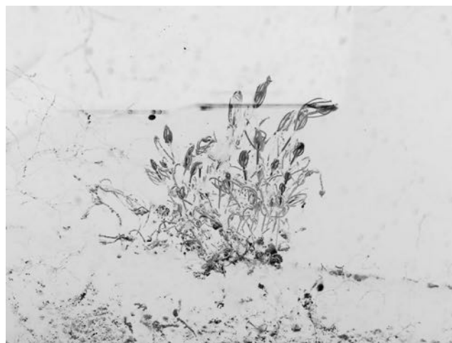
Aigua 5 , 2019, 30 x 40 cm, ed. de 10 ex.