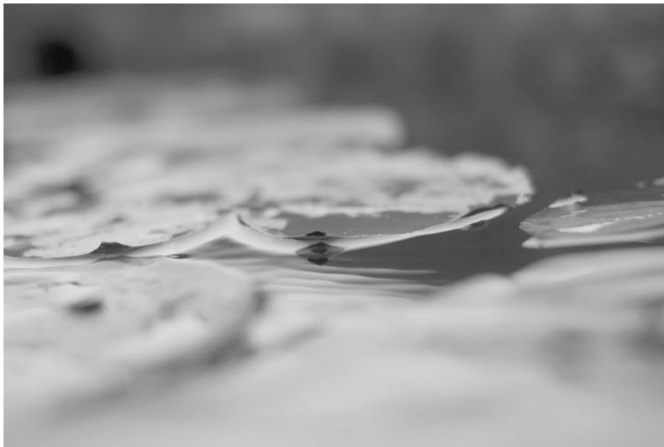
Aigua-aire 3 , 2019, 30 x 40 cm, ed. de 10 ex.

17 de març del 2021 – 29 de maig del 2021