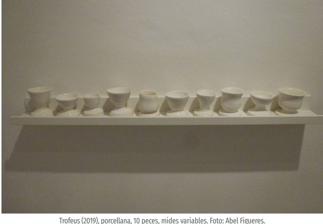
Trofeus (2019), porcellana, 10 peces, mides variables.

Trofeus és una obra formada per 10 peces de petites dimensions situades sobre un prestatge. Totes són blanques, però no n'hi ha cap d'igual. És una sèrie que es planteja una forma general semblant, però que mai es repeteix de la mateixa manera, totes les peces tenen el seu caràcter individualitzat, totes tenen alguna particularitat que les distingeix de les altres. L'aspecte genèric recorda una mena de copa o petit recipient i no amaga una certa imperfecció artesana que ens les fa més humanes, més properes, més íntimes. Probablement són totes aquestes coses les que donen a aquesta obra múltiple el seu sentit més metafòric i carregat de connotacions.