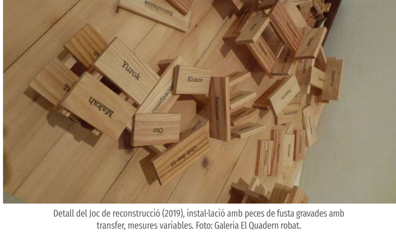
Detall del Joc de reconstrucció (2019), instal·lació amb peces de fusta gravades amb transfer, mesures variables.

A la mateixa saleta, en un altre racó, una obra tridimensional aparentment més lúdica ens espera a terra i ens convida a participar. Es tracta d'un joc de construcció de centenars de peces de fusta que ens permet crear habitacles simbòlics tot jugant; totes les peces estan a la nostra disposició perquè les utilitzem segons el nostre criteri i la nostra creativitat. Però no és un joc només per a passar l'estona sinó que és també un Joc de reconstrucció (2019) que fa referència a unes cultures que han estat anorreades, menyspreades i arraconades per l'acció dels colonitzadors. Cadascuna de les peces du el nom d'una de les tribus índies que poblaven els territoris de l'Amèrica del Nord, els mateixos noms que podem veure també al vídeo Once upon a territory relacionats amb uns llocs i uns territoris concrets. D'aquesta manera podem jugar a reconstruir simbòlicament la relació entre els territoris, les tribus i les cultures, com a mínim, pel que fa a la nostra memòria històrica individual i col·lectiva.