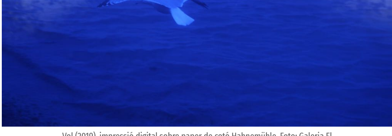
Vol (2019), impressió digital sobre paper de cotó Hahnemühle.

L'altre vídeo, molt més curt, mostra diversos Ocells en diferents moments i situacions. Són imatges d'aus que emprenen el vol, que es detenen per a descansar, que es relacionen amb els boscos, amb l'aire, amb l'aigua.