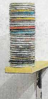
'Pila de tapes', 2016.