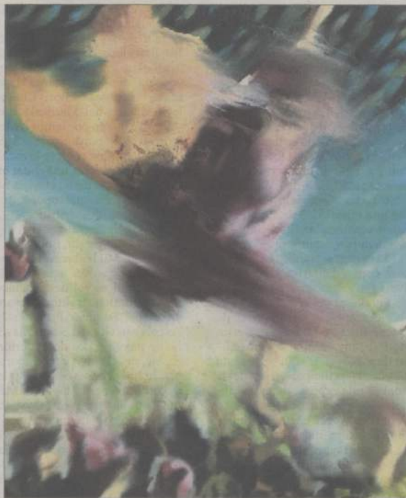
ARTUR RAMON ART