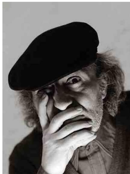
Joan Ponç, Ceret (Francia) 1978, 40 x 30 cm

a la interpretación de la luz. Desde 1960 se dedicó al reportaje social con otros colaboradores, decantándose más tarde por encargos de calidad en el mundo industrial y publicitario. En los años setenta entró en contacto con el mundo del arte, que le fascinó profundamente. A partir de entonces, se especializó en la fotografía de obras de arte, y puso todos los medios técnicos y su oficio, para reproducir las obras de forma exacta y captar, además, todo lo que los artistas querían expresar en ellas. Esto le lleva a colaborar con editoriales, museos, galerías, y a tener un contacto estrecho y enriquecedor con muchos artistas, como Tàpies, Subirachs, Guinovart, Aguilar, Plensa, Riera i Aragó, Brossa y tantos otros. Las fotografías de Martí Gasull han sido publicadas en numerosos libros y catálogos.