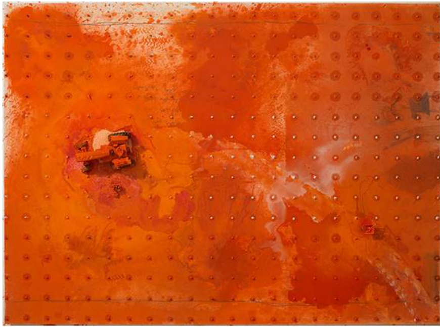
"Tractor carbassa" 2012-2014, mixta sobre fusta, 157 x 206 x 18 cm

Inauguració dijous 29 d'octubre de 2015 a partir de les 19 h