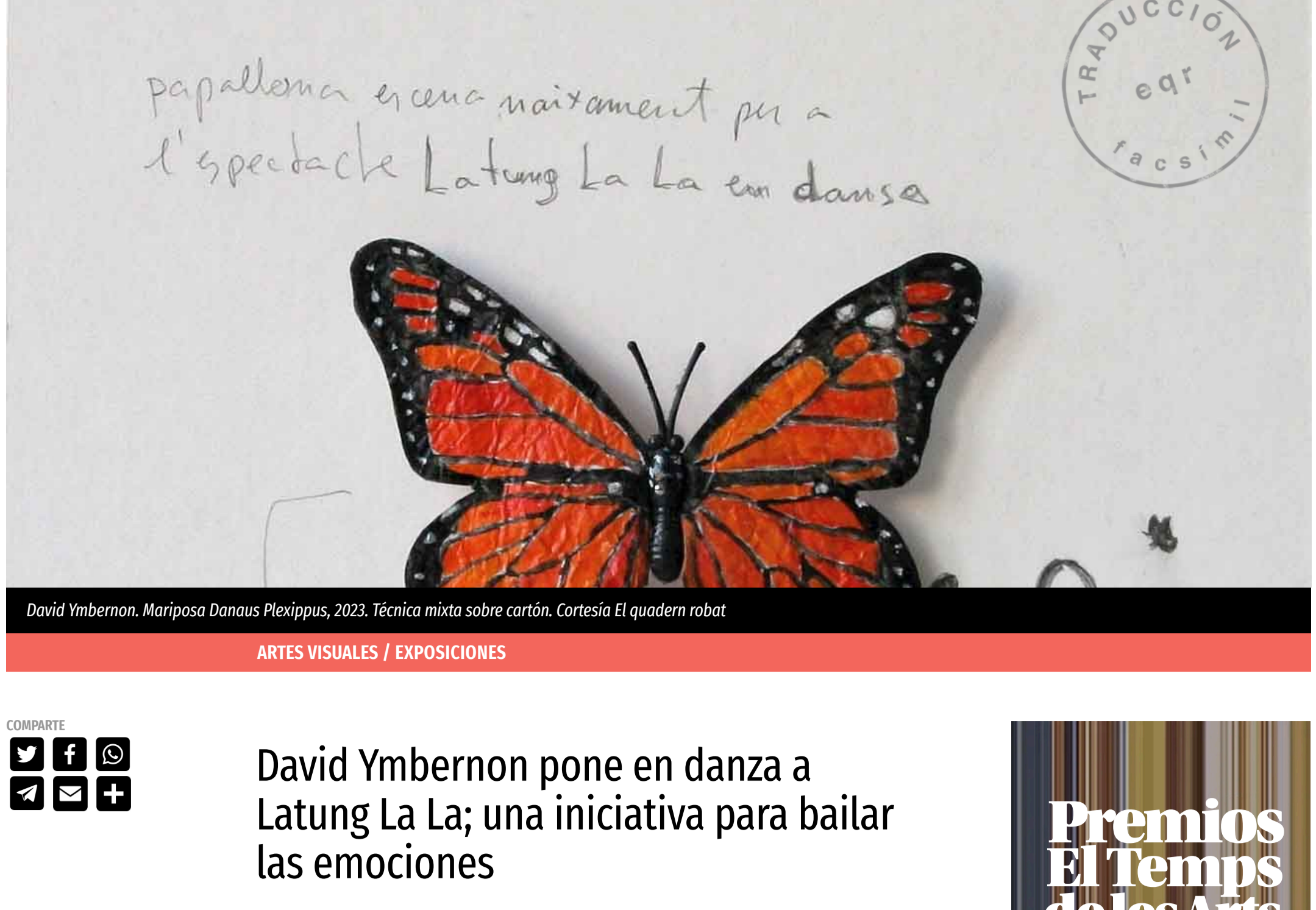
David Ymberson. Mariposa Danaus Plexippus, 2023. Técnica mixta sobre cartón.