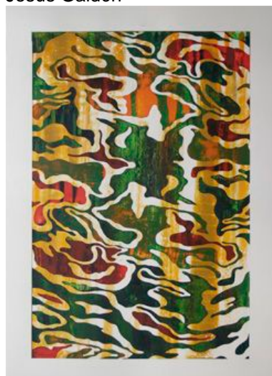
Pintura camuflada ( affectueusement ) 2022 acrílic sobre paper Fabriano, 70 x 50 cm