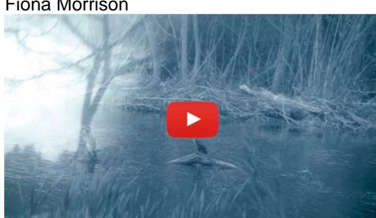
Ocells, 2019, vídeo: 5' 48" edició d'1 exemplar + 1 PA