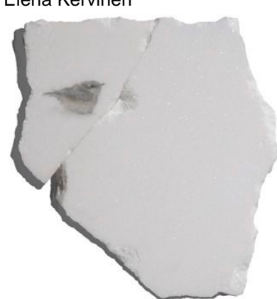
Post, 2021, llapis i llapis de colors sobre marbre, 24,5 x 23,5 x 2 cm