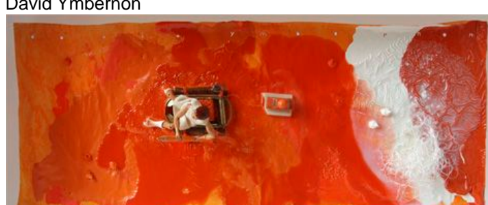
Sense títol, 2012, tècnica mixta sobre paper, 45 x 89 x 20,5 cm