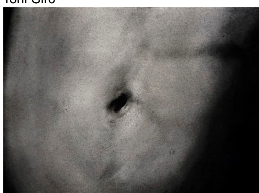
Bilis negra. Melic, 2020, pols de grafit i cendres sobre paper artesà de cotó, 51 x 65 cm