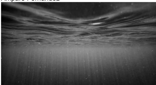
Aigua i llum, 2021, impressió digital, 45 x 80 cm, edició de 5 ex.