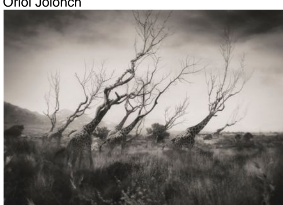
El jardín de las jirafas mutantes, 2021, impressió digital, 60 x 80 cm. edició de 5 ex.