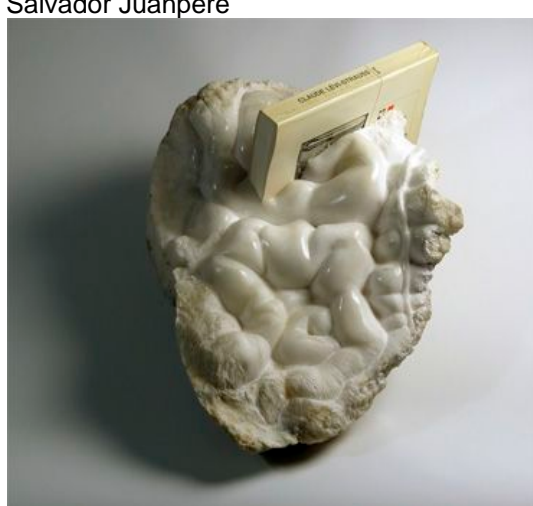
Le cru et le cuit, 1987-2015, alabastre i llibre 50 x 36 x 30 cm