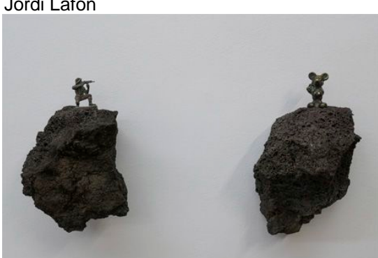
La mort dels innocents, 2022, bronze i pedra volcànica, 50 x 25 x 14 cm