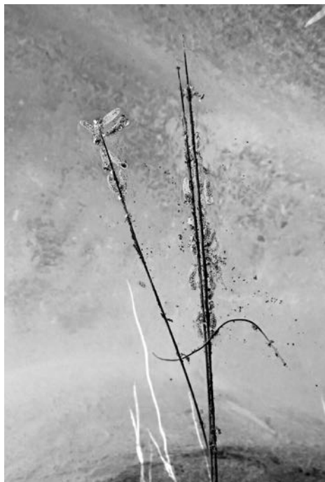
Aigua 7 , 2019, 40 x 30 cm, ed. de 10 ej.