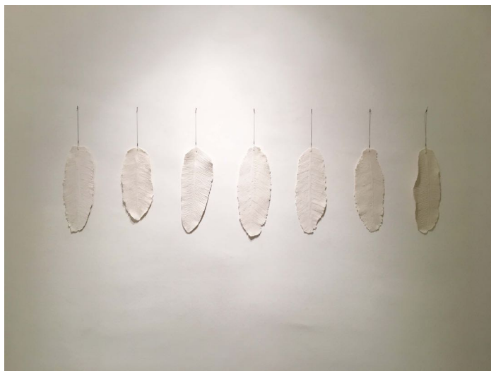
Set plomes , 2020, porcellana, mesures variables

present en representació d'Andorra. El vídeo reproduïx la passejada per un bosc d'una àvia amb la seva neta; dues dones amb una proximitat consanguínia i espacial, però separades pels anys. Two Walks és una vanitas en moviment: el temps passa de manera inexorable per a tots els éssers vius. La vida és fràgil i breu, el nostre trànsit pel món i per la vida és efímer, però si anem més enllà del concret, ens adonem que és etern, perquè tot comença i acaba una vegada i una altra, i així fins a l'eternitat.. Les obres que presentem a l'exposició El vol , ens remetent també a la idea de vestigi. Les plomes de la instal·lació Set plomes esdevenen rastres de vida i de pas pel món, testimonis de de la mutació i del