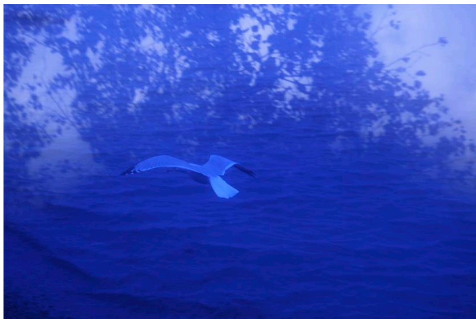
Vol , 2019, impressió digital, 160 x 200 cm, exemplar únic

18 de novembre del 2020 – 30 de gener del 2021