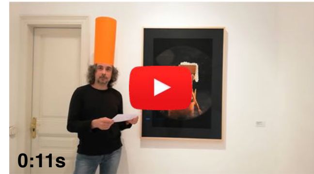
4 Vídeo Poema, Només hi ve ell...18/06/2020

Només hi ve ell, aquí, cuida el record rega les plantes i dóna menjar a les ales