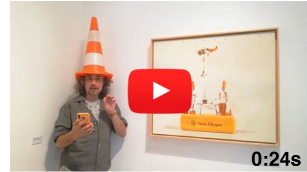
7 Vídeo Poema, La Llacuna, 22/07/2020

Les arrels que em sustenten són els timbals a la Plaça Major de La Llacuna.