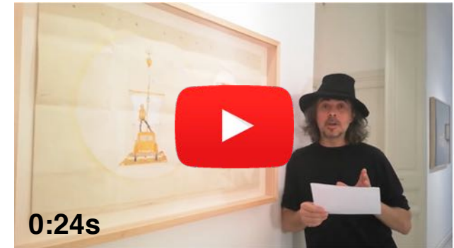
5 Vídeo Poema, El vestit dr mag...02/07/2020

El vestit de maga brillava preciós com si les arrels vestissin d'estels. Les mans i el sol es ponien en el teu caminar recordant aquell instant precís que baixava etern per les escales.