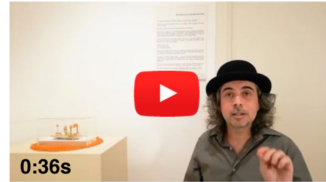
2 Vídeo Poema, Es van construir..., 05/06/2020

I a l'aigua si mires bé encara s'hi veu el seu rastre.