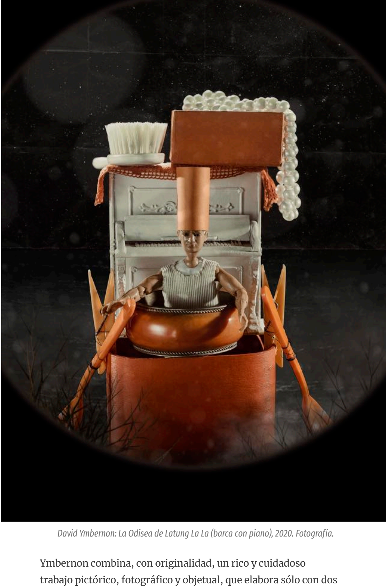
David Ymbernon: La Odisea de Latung La La (barca con piano), 2020. Fotografía.

La singularidad de estas epopeyas Ymbernonianas, que el artista ha ido madurando y personalizando a lo largo de los años, radica, justamente, en esta evocación de la intrascendencia en el arte. Él siempre ha dicho: “Todo lo que sé, lo he aprendido en el recreo” y lo ha demostrado con creces. Es esta dimensión lúdica que confiere a su obra el pulso de libertad, frescura, ingrávidez y la puerilidad propia de un mundo onírico que la caracteriza y que Ymbernon sabe materializar y presentar, con un relato poético que configura cada evento y el hilo argumental que enlaza una y cada una de las obras.