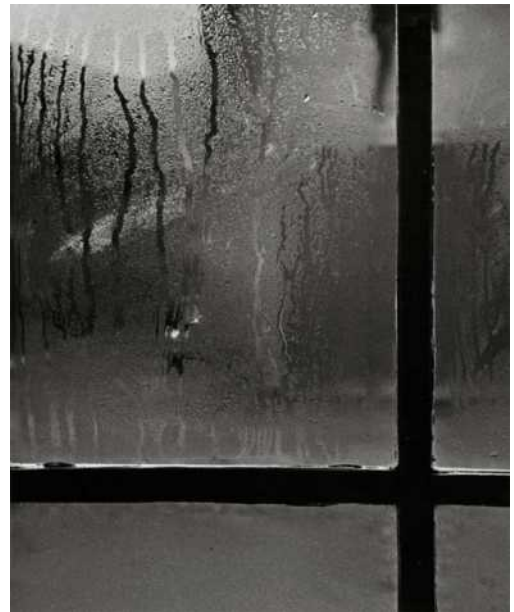
Lágrimas de invierno, anys 50, positivat de l'època, sobre paper baritat, 34 x 28 cm, ex. únic