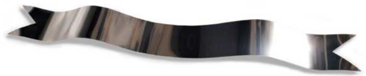
No dir res, 2006, acer inoxidable polit., 20 x 188,5 x 12 cm