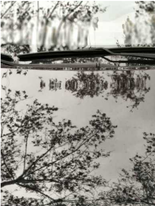
Metamorfòpsia I, 2018, impressió digital, 51,41 x 38,81 cm, ed. 5 ex.