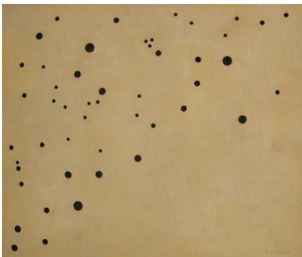
Sense títol, 2012, mixta sobre fusta, 42,5 x 50,5 cm