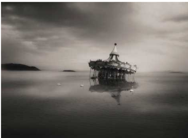
Carrusel, 2019, impressió digital, 60 x 80 cm, ed, 5 ex.