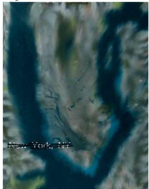
New York, 12-3-15, 2012, oli sobre tela, 116 x 89 cm