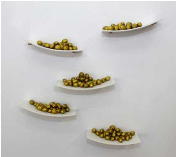
Massa soroll, 2019, tècnica mixta, 80 x 80 x 13 cm