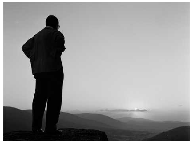
Martí Gasull Coral, 1965, impressió digital, 2016, 30 x 40 cm, ed. 5 ex.