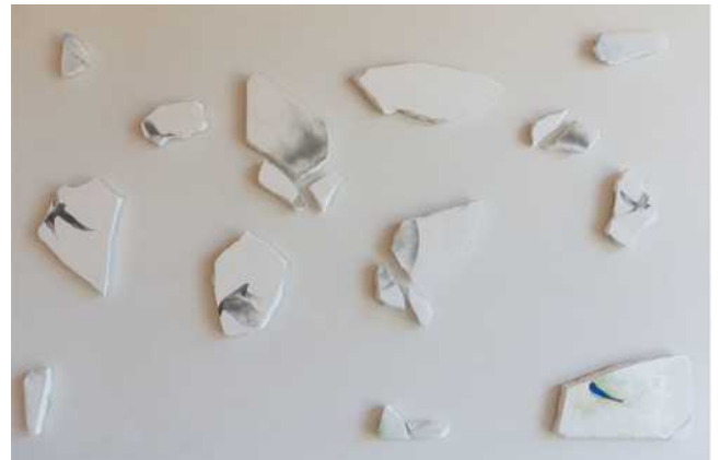
Viure la bellesa, 2019, tècnica mixta sobre marbre, 85 x 137 x 2 cm