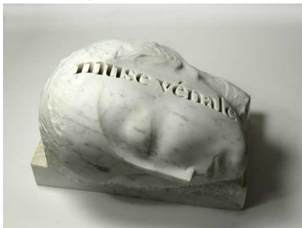
Muse vénale, 2015, marbre de Carrara, 30 x 43 x 34 cm