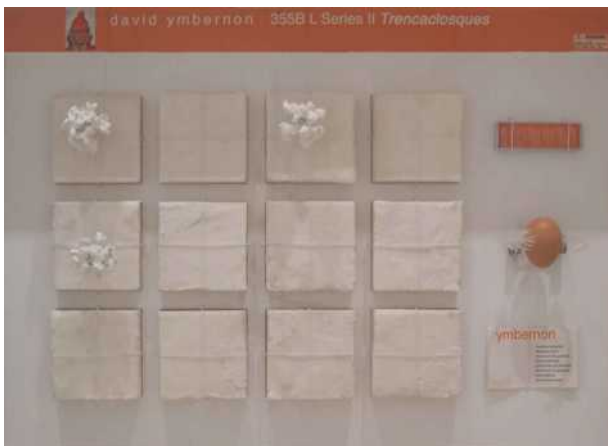
355B L Series II Trencaclosques , 2006, tècnica mixta, 63 x 83 x 15 cm