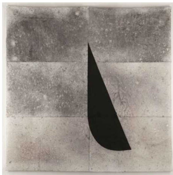
Dois Irmaus, 2018, tinta xinesa sobre paper ukiyo, 200 x 200 cm

La paraula “monòlit” fa referència tant a formacions geològiques naturals com a construccions humanes que es caracteritzen per ser un bloc de pedra de grans dimensions. Ja en la prehistòria, la veneració envers aquestes grans pedres naturals,