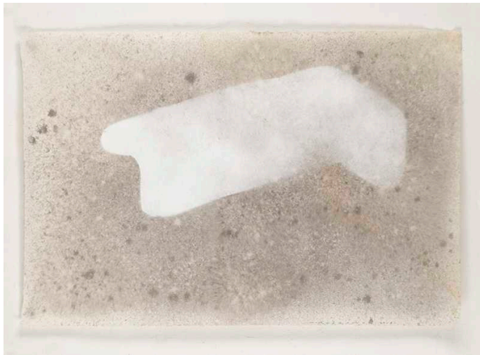
Protòlit, 2018, tinta xinesa sobre paper ukiyo, 65 x 90 cm

Les obres que presentem ara són una lliure interpretació de monòlits, majoritàriament naturals, que encara avui dia podem trobar. La lleugeresa de les formes representades en les