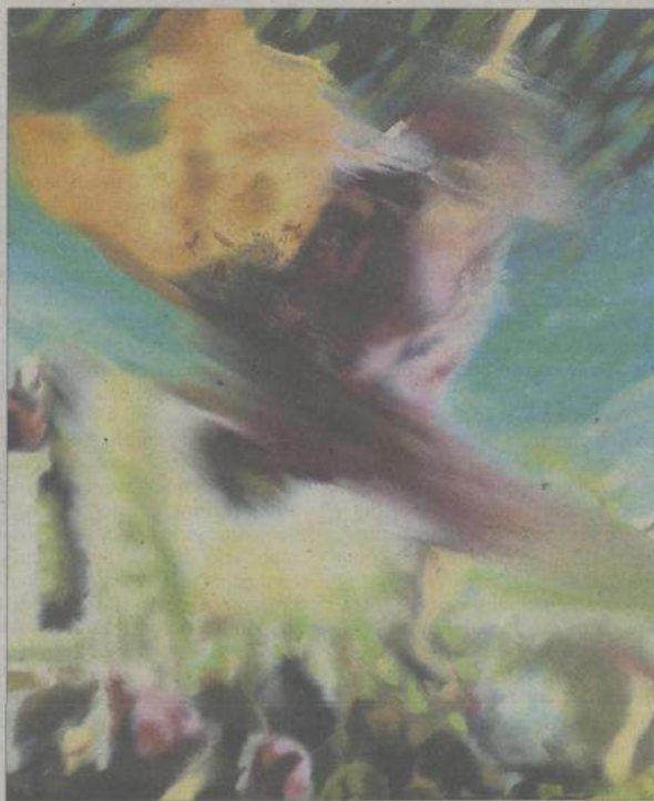
ARTUR RAMON ART

ahora la obra reciente de Jorge R. Pombo, que despliega una serie de variaciones contemporáneas a partir de un tema cuyo origen se encuentra en el arte antiguo. Las pinturas y dibujos recientes que expone Pombo con el título Variaciones de Tintoretto son paisajes con figuras borrosas. Tienden a la abstracción por medios que son pictóricos, pero que parecen fotográficos además de puramente pictóricos. Los paisajes desenfocados de Pombo, con cielos azul verdes de crepúsculo y con zonas como nubes encendidas, remiten tanto al cuadro de Jacopo Robusti (El Tintoretto) titulado El milagro de San Marcos (1548) como a la pintura posfotográfica de Gerhard Richter, Galería Artur Ra-