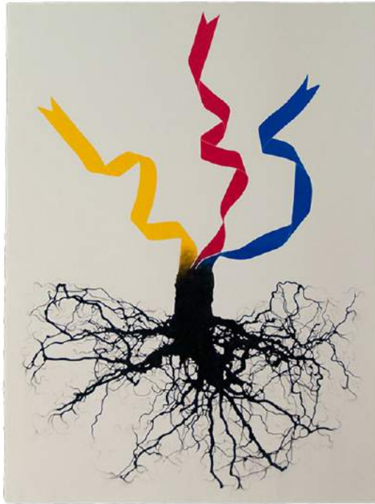
Sèrie arrels - Arbre 2012, carbonet i pastel sobre paper, 76 x 56 cm

19 d'octubre de 2017 - 30 de gener de 2018