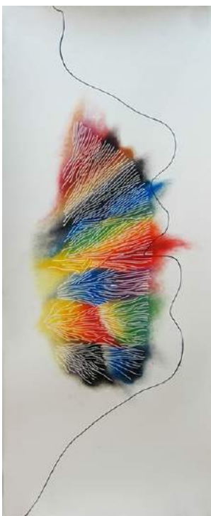
Air de Paris 2013, 105 x 45 cm

que passa esta connectat, tot té un origen. De la mateixa manera que les branques d'un arbre estan connectades a les arrels a través del tronc, les nostres mans o la nostra veu estan connectades al nostre interior o a la nostra memòria a través del cos. Les arrels són el lloc on s'originen totes les coses, i a la vegada estan connectades a altres arrels, i així fins a l'infinit, però establint sempre un cercle de relacions, en una referència inequívoca a la idea d'etern retorn. Galdón fa referència a les arrels del llenguatge escrit i pictòric a través d'uns filacteris que formen un brancatge i que porten llegendes escrites o que representen els colors primaris.