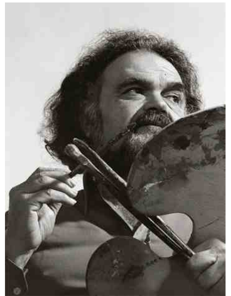
Josep Guinovart, Barcelona 1983, 40 x 30 cm