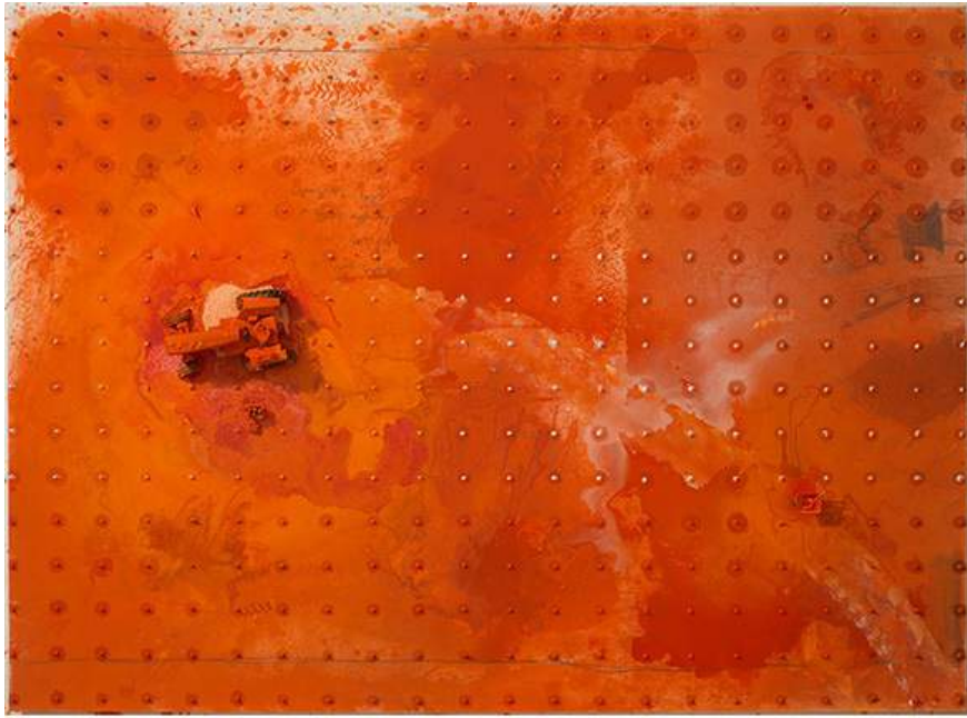
"Tractor carbassa" 2012-2014, mixta sobre madera, 157 x 206 x 18 cm

Inauguración, jueves 29 de octubre de 2015 a partir de las 19 h