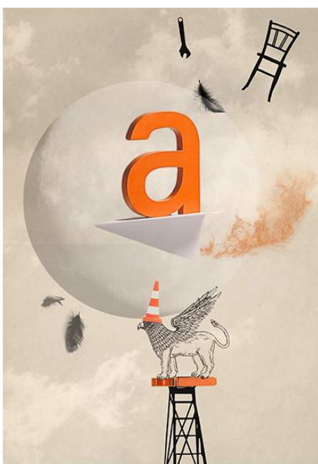
"s/t" 2014, giclée, 41,78 x 29 cm, ed. 50

La exposición: David Ymberton El quadern de Latung La La estará abierta hasta el 30 de enero de 2016