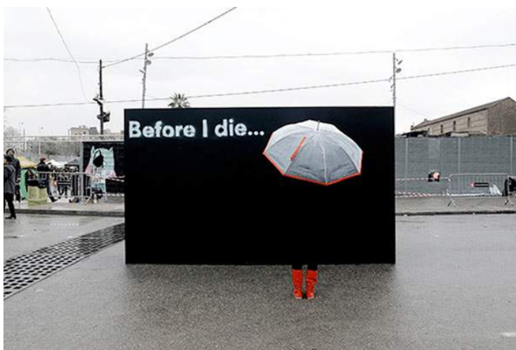
Sin título, 2014

Inauguración jueves 5 de marzo de 2015 a partir de las 19 h.