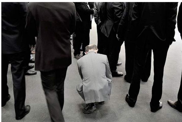
Sin título, 2012