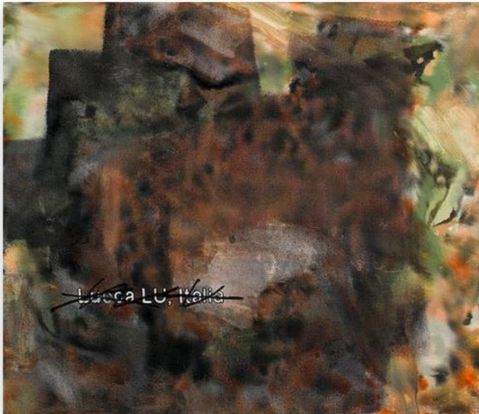
"Lucca 4" 2013, oli sobre tela 96,7 x 112 cm.