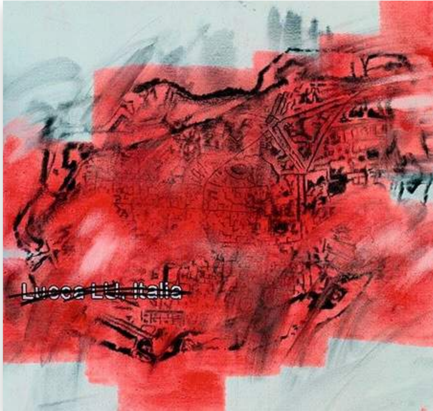
"Lucca 1" 2013, oli sobre tela 91,5 x 96,7 cm.