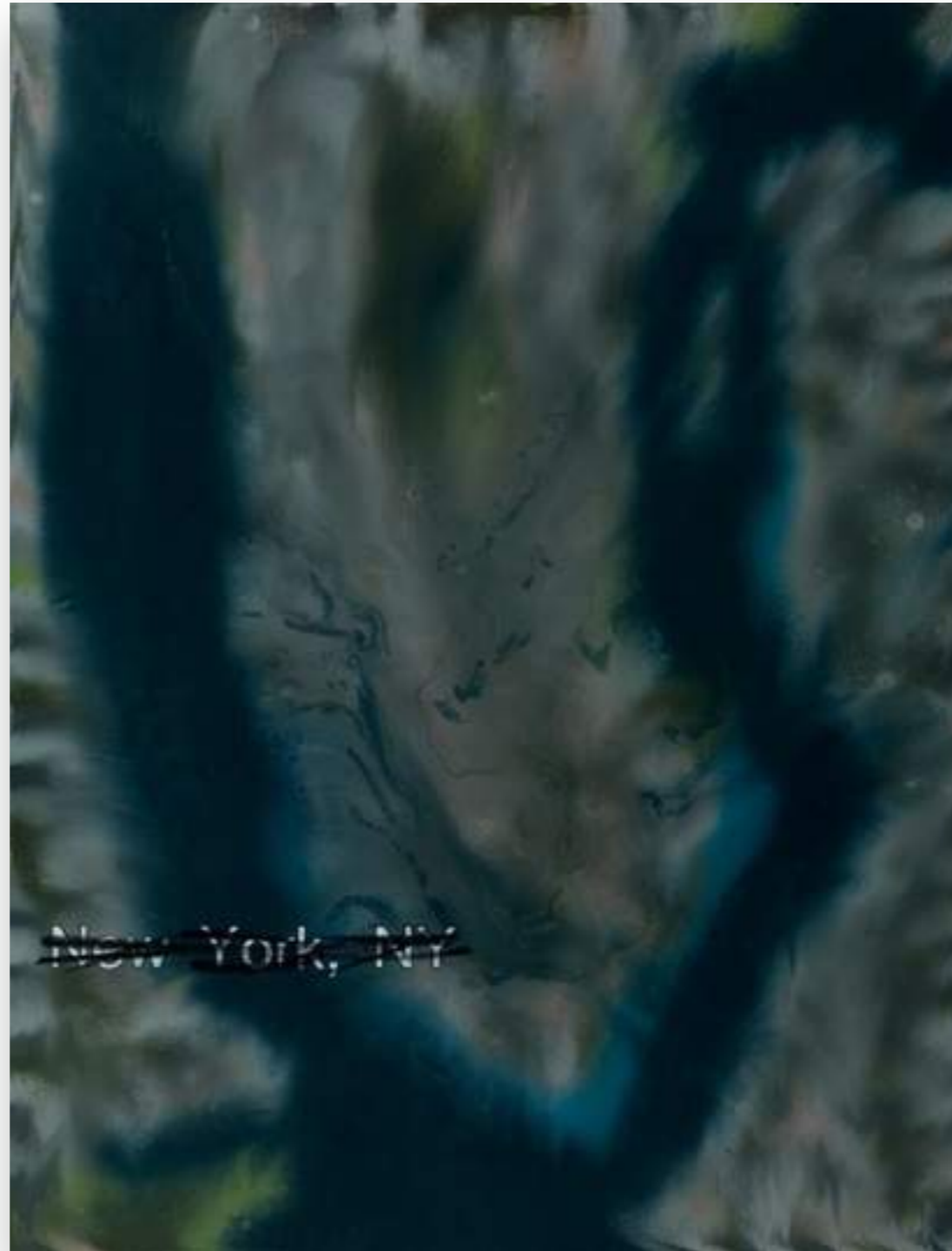
“New York,12-3/15” 2012, oli sobre tela 116 x 90 cm.