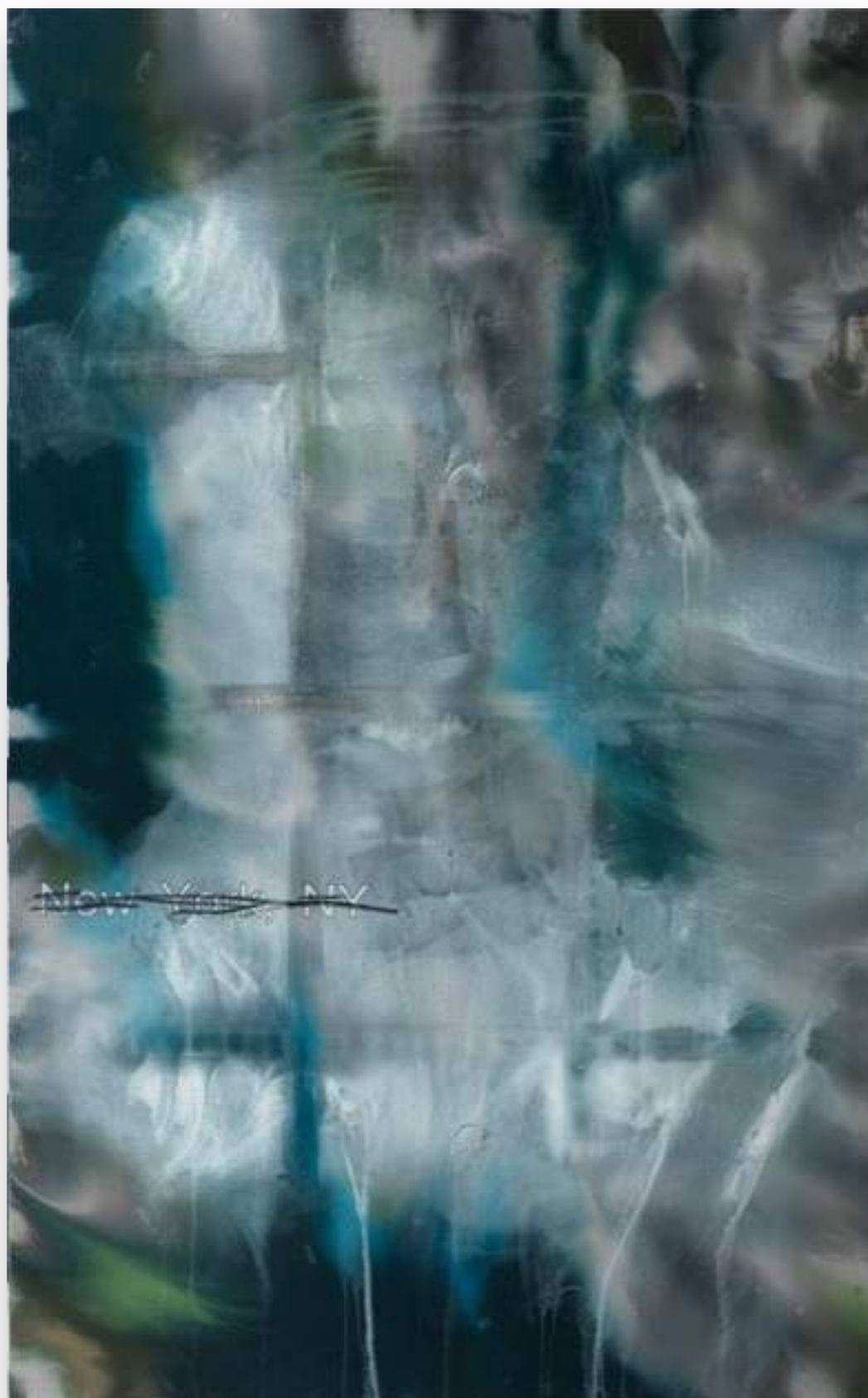
“New York,12-3/13” 2012, oli sobre tela 267 x 166 cm.