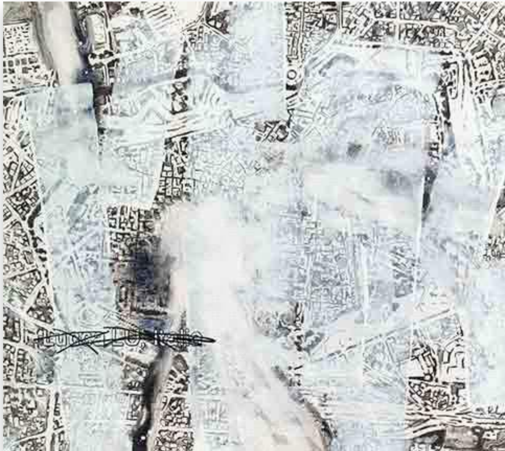
“Lucca 10” 2013, oli sobre tela 170 x 190 cm.