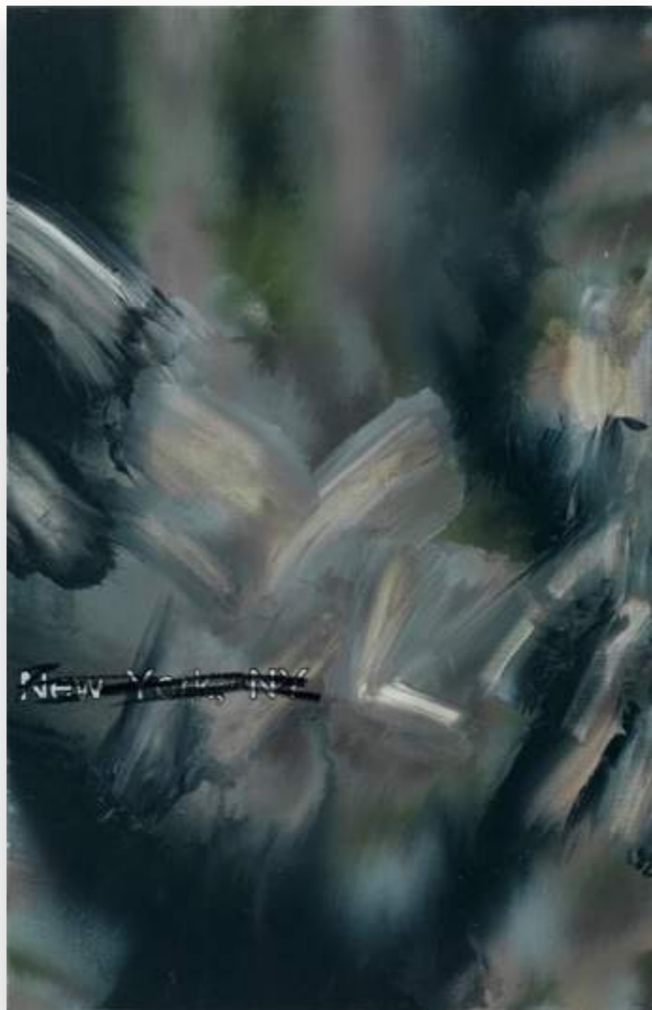
“New York,12-2/13” 2012, oli sobre tela 100 x 65 cm.