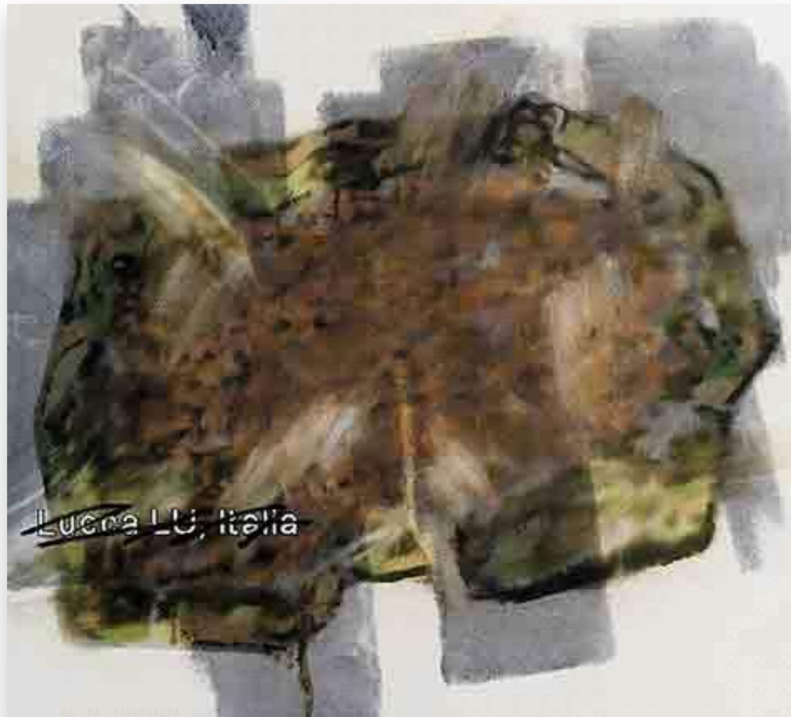
"Lucca 7" 2013, oli sobre tela 91,5 x 102 cm.