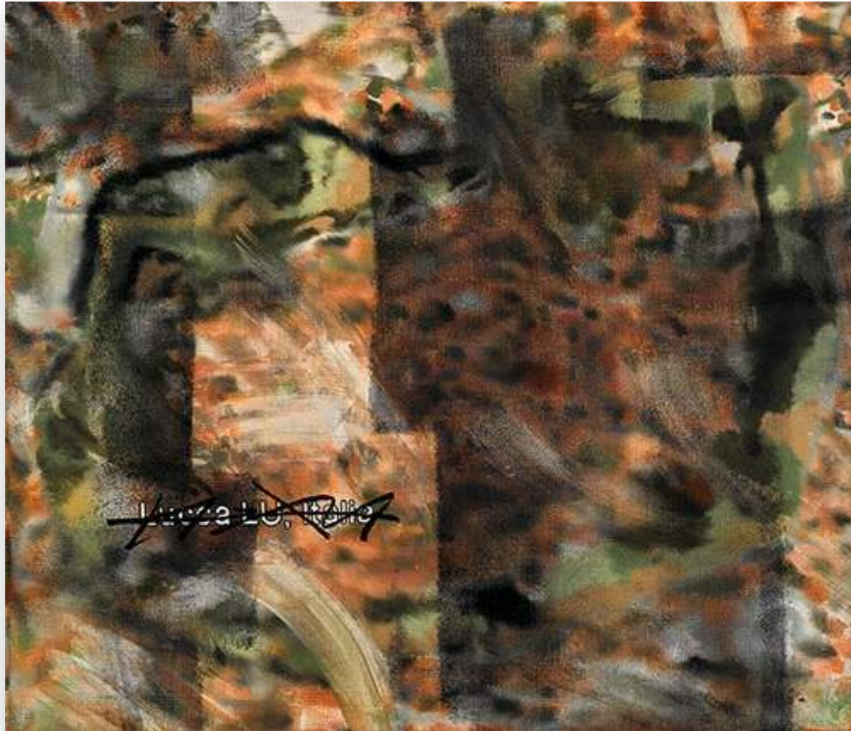
"Lucca 3" 2013, oli sobre tela 96,7 x 112 cm.