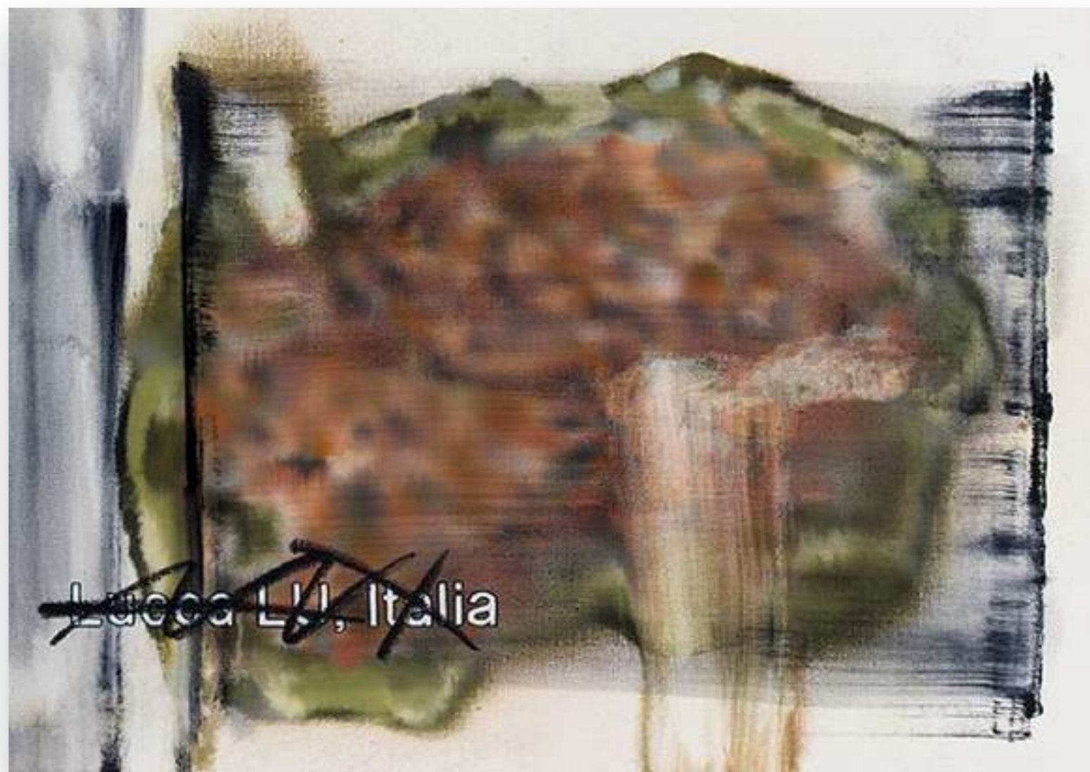
"Lucca 6" 2013, oli sobre tela 61 x 86,5 cm.