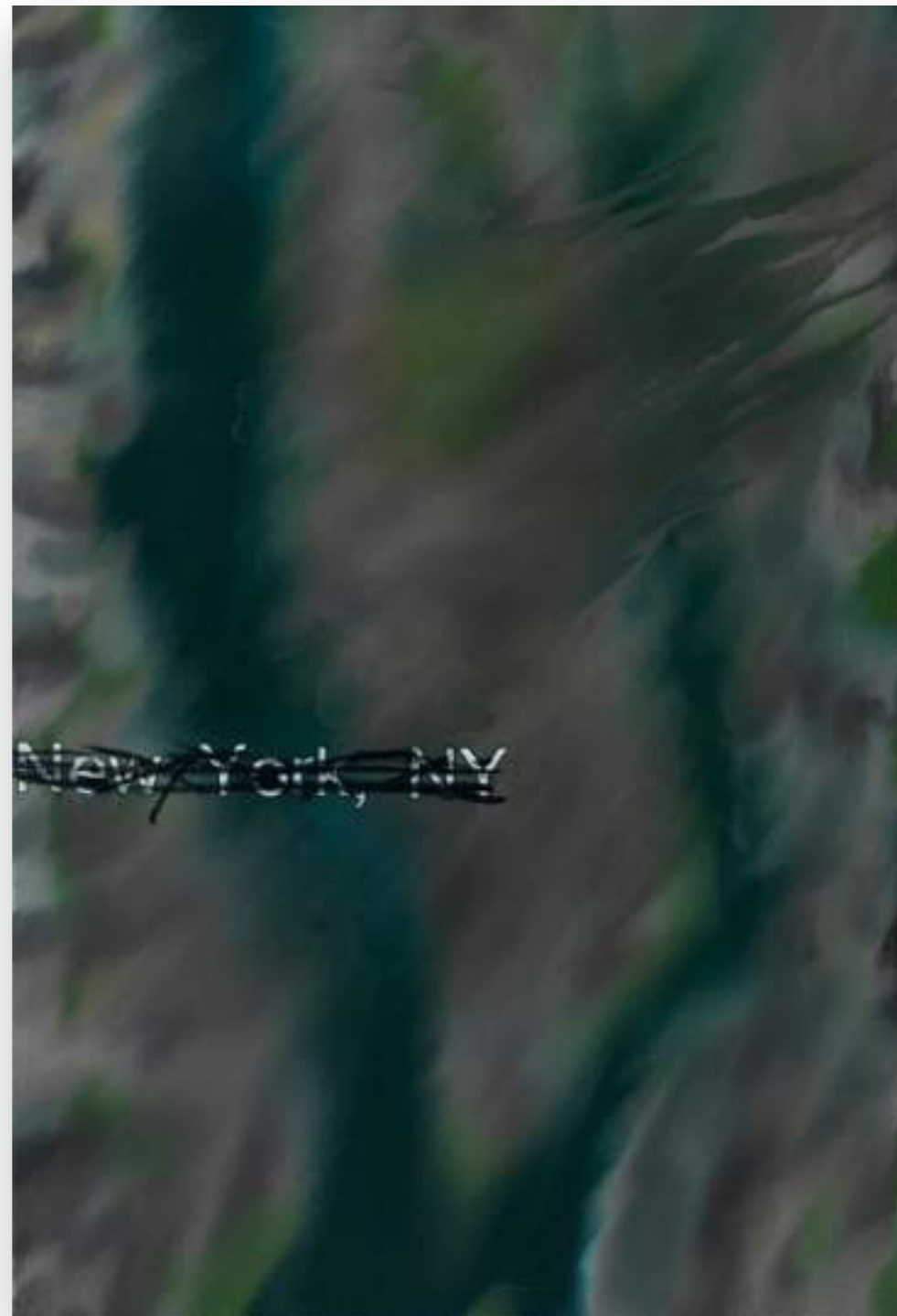
“New York,12-1/10” 2012, oli sobre tela 116 x 73 cm.