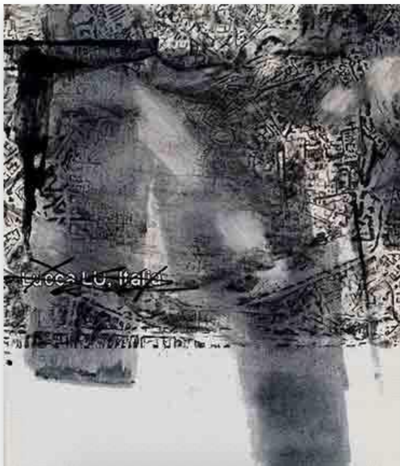
"Lucca 8" 2013, oli sobre tela 112 x 86,5 cm.