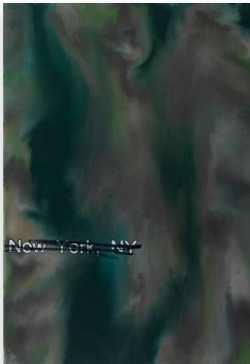
“New York,12-1/11” 2012, oli sobre tela 73 x 50 cm.