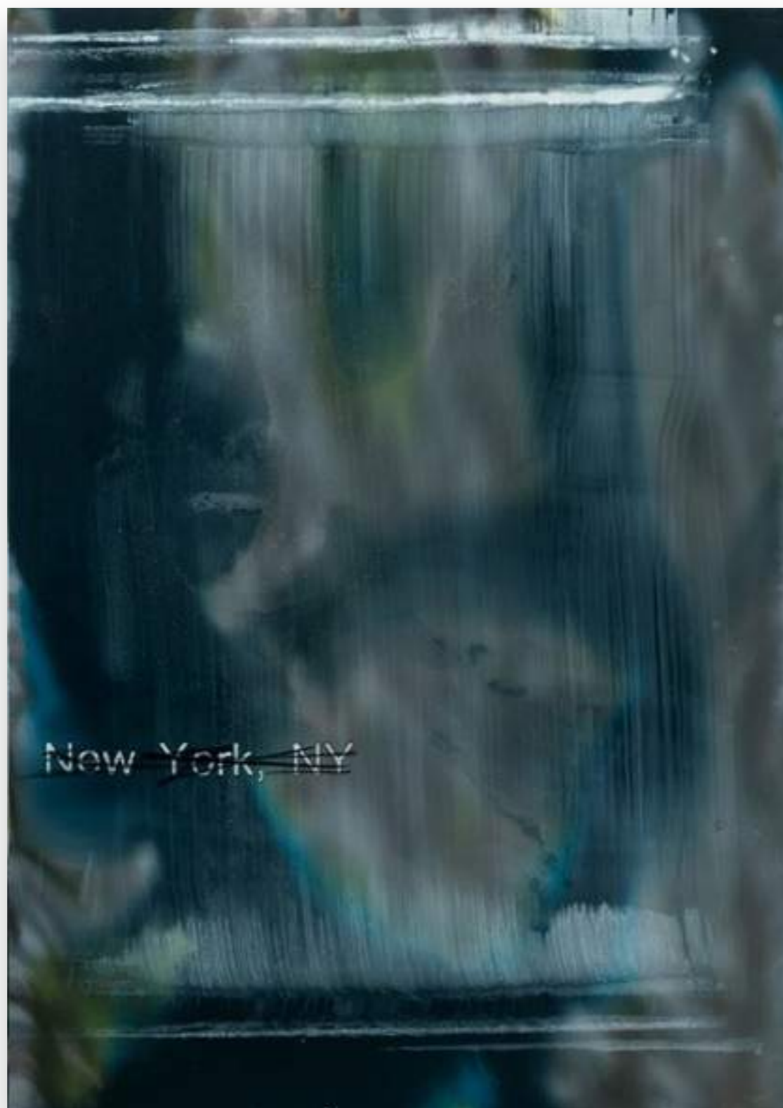
“New York,12-3/12” 2012, oli sobre tela 170 x 120 cm.