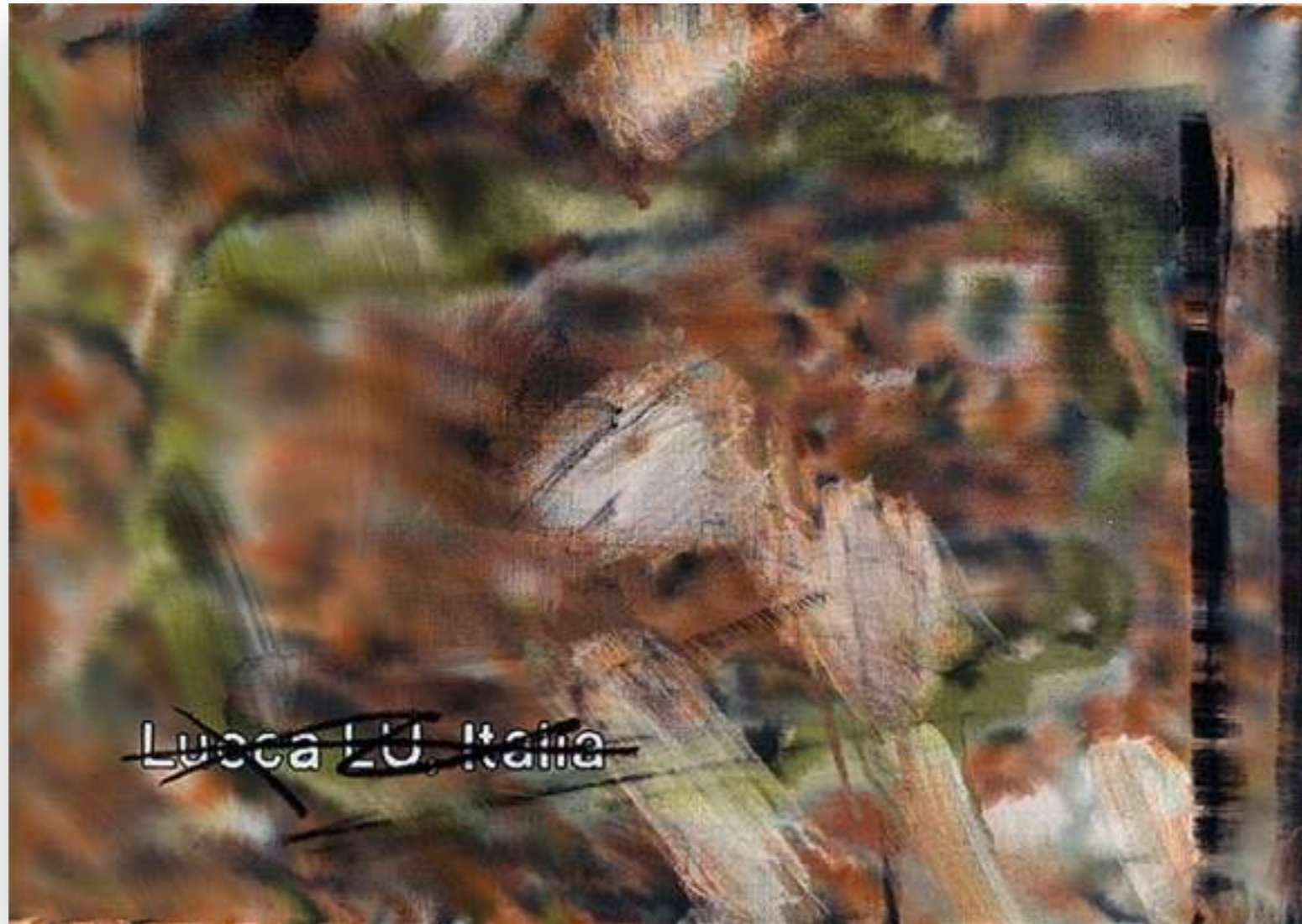
"Lucca 5" 2013, oli sobre tela 61 x 86,5 cm.