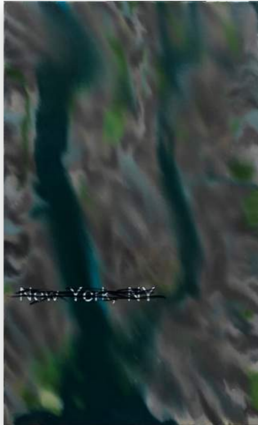
“New York,12-2/1” 2012, oli sobre tela 146 x 89 cm.